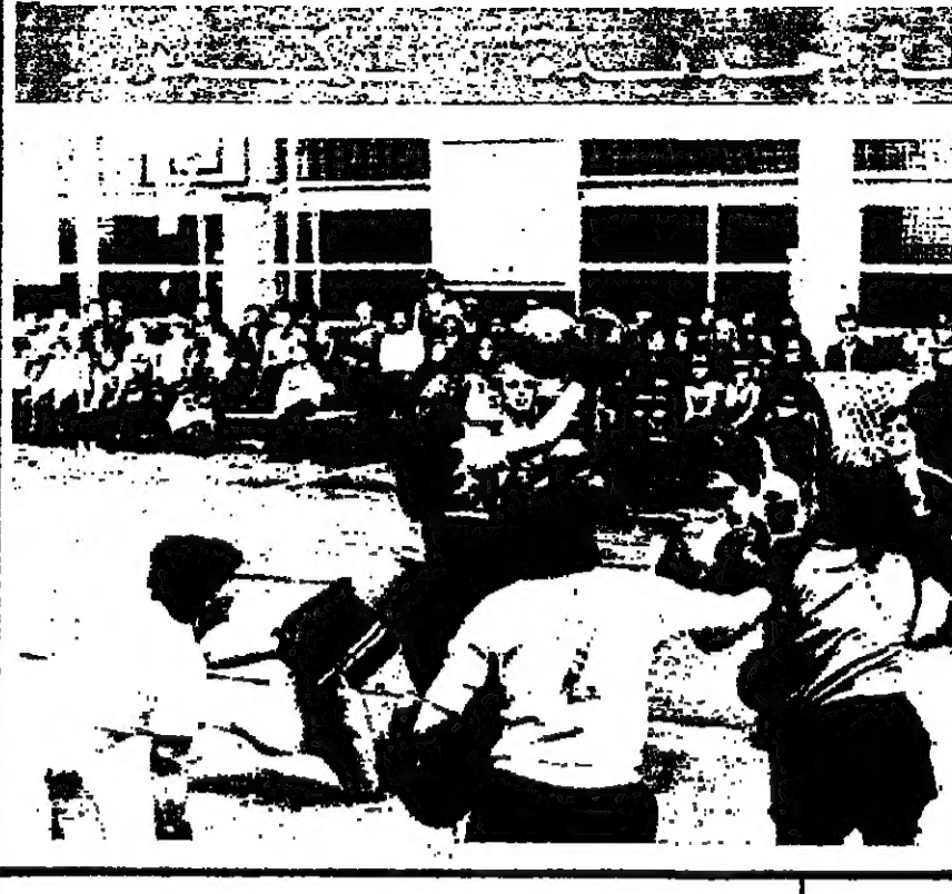
تنتشر في القبة الديمقراطية رياضة من نوع جديد تسمى «يوكسبول» وهي لعبة تجمع بين الكرة والصوره لحد الفرفر التسلية...

الأسلوب الخاص! قال مدرب الكرة العالمي «نيولا» انه يجب على كل لاعب في خط الهجوم أن يتفكر أنه ليس من الضروري أن يصعب «بيليه» أو «فارنشيا» أيام زمان، وأن محاولة تقليد النجوم قد تكون أمرا خطرا لأن العديد من لاعبي الإتحاد في البرازيل عاونا من مرارة الفشل الخرس في السنين الأخيرة بسبب عقدة «بيليه» وأصرارهم على التقليد في إجراء مراهقات مستحيلة. قد تكون نصيحة المدرب الخبير للاعبين غير واردة بالنسبة لراؤولي كرة القدم في لبنان، على اعتبار أن اللعبة في الخارج شيء، وعندما يشهه آخر، وأن أسلوب اللعب الذي يفضل بين «الذين يتفكرون» هو فصل بين «الذين لا يفكرون» إلا أن النصيحة يجوز نقلها هنا بعد «تعريبها» وجعلها تتفق ومستمرة التي تتوافق معهم. فلاكت من «عبي اليوم» يفهم حب الظهور التي يتفرد بها اللاعبين المحرومين قلما منهم أن يتفقدوا: الجانج من شدة أن يفهمهم عالم الأنواء، وهذا خطأ. فكل لاعب شخصيته واسلوبه وطريقة لعبه. وعندما يضع اللاعب شخصيته ويحاول الإلتزام أو التقليد فإنه ولا شك سيضيع في اللعب. إن لاعب كرة القدم هو مثل الحارب أو المقاتل أو أي شأن آخر. فإذا لم يجد هذا اللاعب ذاته بولونه واسلوبه المميز الخاص لا يتخذ طريقه إلى الشهرة وتبقى على نفسه!